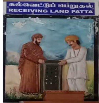
கல்வெட்டுப் பெறுதல் RECEIVING LAND PATTA