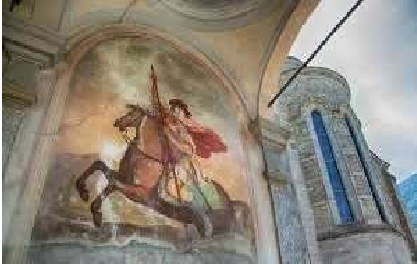
புனித மெளரிசியோ திருப்பயணம் தொடரும்.....